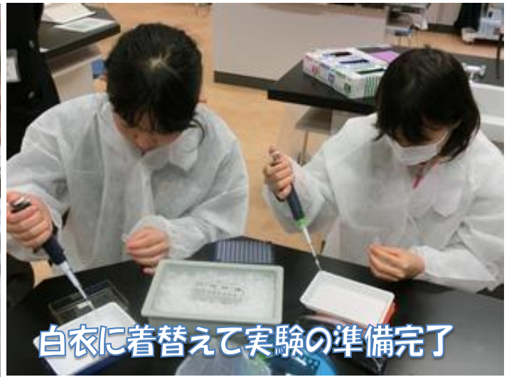
白衣に着替えて実験の準備完了