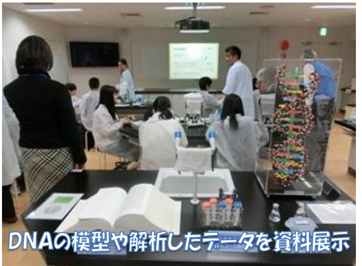
DNAの模型や解析したデータを資料展示