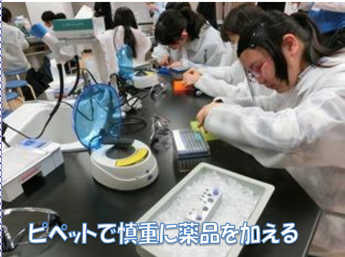
ピペットで慎重に薬品を加える