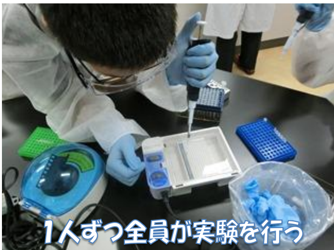
1人ずつ全員が実験を行う