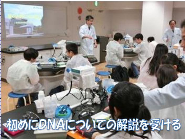
初めにDNAについての解説を受ける