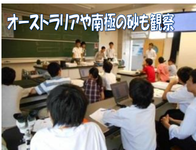
オーストラリアや南極の砂も観察