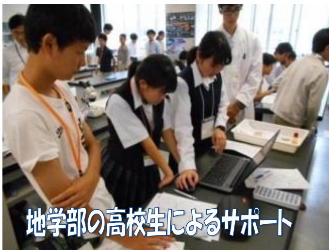
地学部の高校生によるサポート