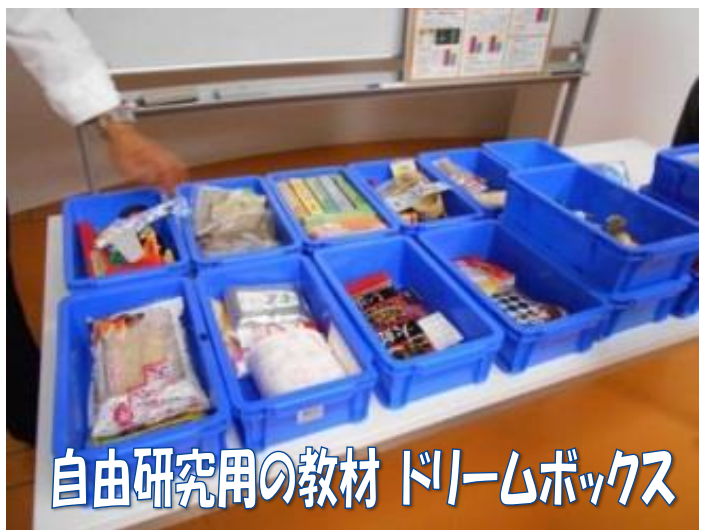
自由研究用の教材 ドリームボックス