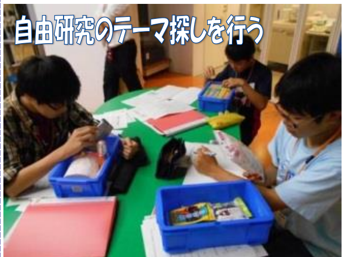
自由研究のテーマ探しを行う