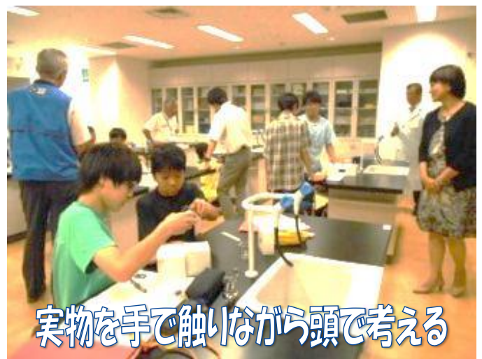
実物を手で触いながら頭で考える