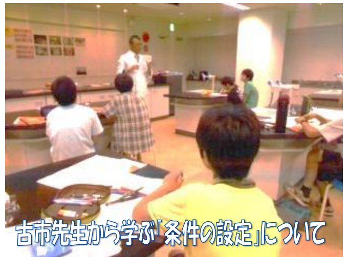
古市先生から学ぶ「条件の設定」について