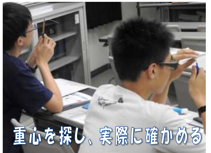
重心を探し、実際に確かめる