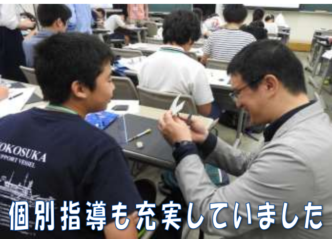
個別指導も充実していました