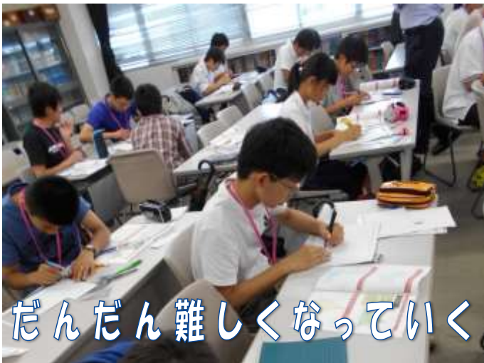
だんだん難しくなっていく