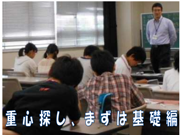
重心探し、まずは基礎編