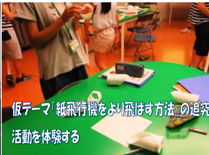
仮テーマ「紙飛行機をより飛ばす方法」の追究活動を体験する