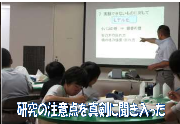
研究の注意点を真剣に聞き入った