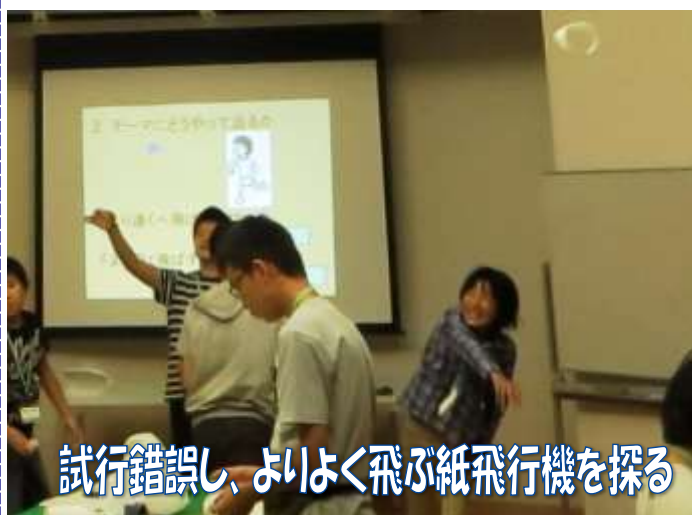
試行錯誤し、よいよく飛ぶ紙飛行機を探る