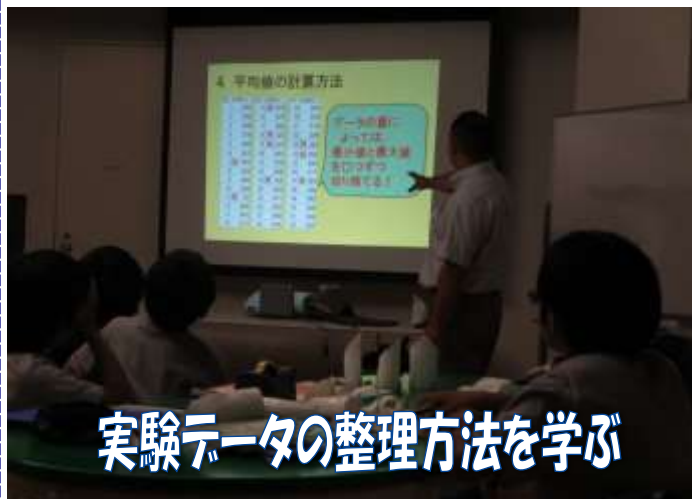
実験データの整理方法を学ぶ