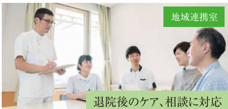
退院後のケア、相談に対応