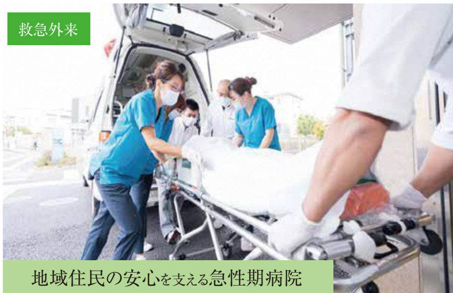
地域住民の安心を支える急性期病院