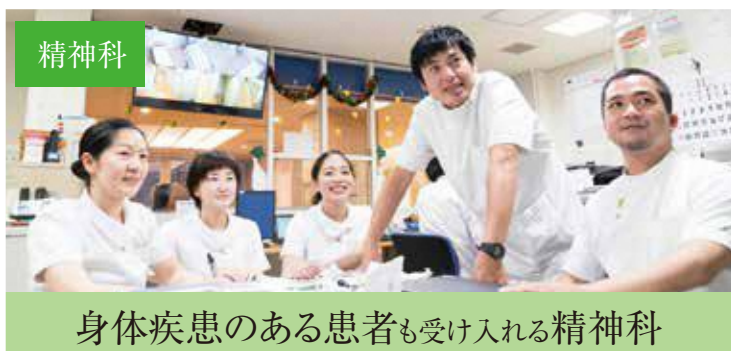
身体疾患のある患者も受け入れる精神科