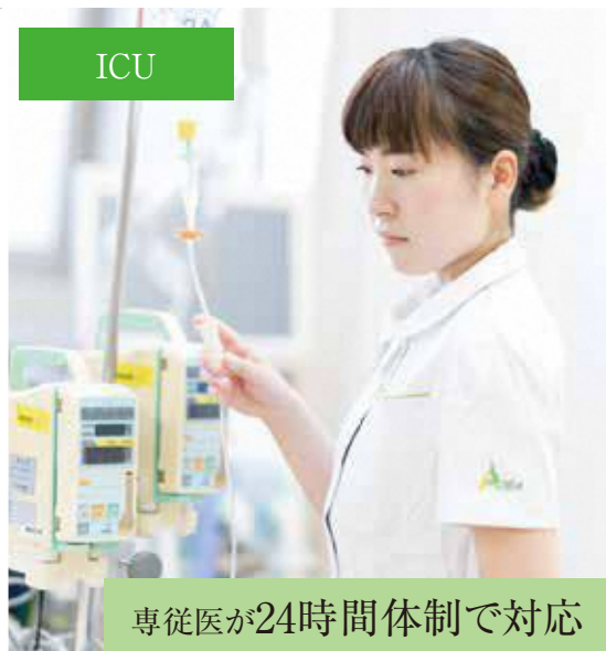
専従医が24時間体制で対応