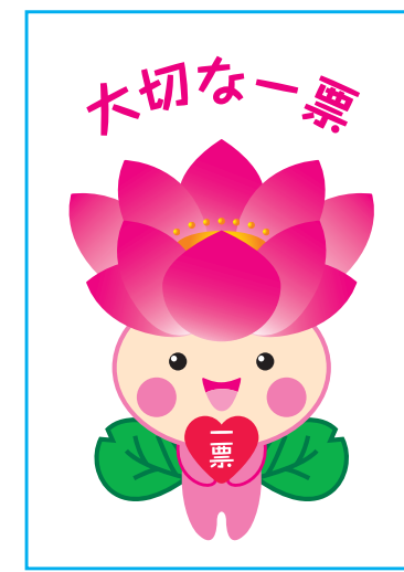
ちはなちゃん選挙バージョン