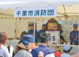
消防団の紙芝居による防災活動

4 消防体制 については、消防団が地域における消防防災の重要な役割を担っていることから、積極的な入団促進活動を展開するほか、災害時の消防力を最大限発揮できるよう、資機材の整備更新を図るなど、引き続きその活動の支援に努められたい。また、女性職員が安心して勤務し活躍できる職場環境の整備に加え、教育機関と連携し本市消防の魅力を積極的にアピールすることにより、優秀な人材の確保にも取り組まれない。