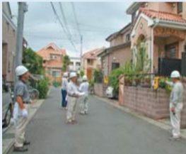
自主防災組織の訓練活動

2 防災対策 については、防災リーダー養成のため開催されている防災ライセンス講座の受講者数が減少していることから、地域の防災活動の担い手となる人材の育成や確保に努めるとともに、地域防災力向上の観点から、自主防災組織や避難所運営委員会の活動に対する支援のさらなる充実強化に努められたい。