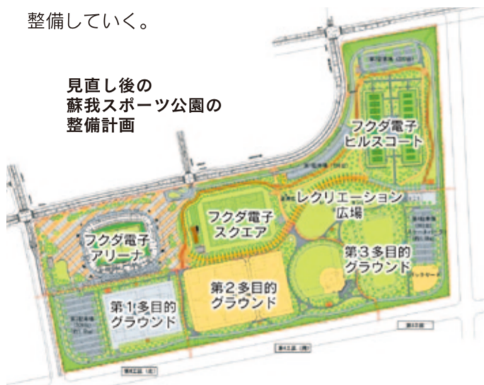
見直し後の 蘇我スポーツ公園の 整備計画

答 陸上競技場やフットサル場など当初計画にあった施設を全面的に見直し、サッカー、ラグビー、野球、グラウンドゴルフなど、多目的な広場として、市民が手軽にスポーツを楽しめるよう整備を進めていく。平成24年初めには第1多目的グラウンドの造成工事に着工し、サッカーや野球などに利用できるグラウンドとして整備を進める予定であり、その他の区域についても順次、整備していく。