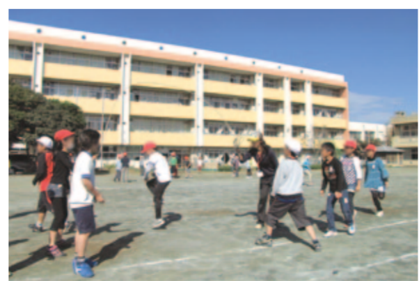
未来を担う子どもたちのためのまちづくりを

答 社会構造の大きな転換点にある中、課題をしっかりと受け止め、正しい将来予測のもと計画的な都市づくりを進め、足腰のしっかりした行財政構造を構築した上で、将来にわたり持続可能で魅力と活力にあふれるまちづくりを目指していきたい。