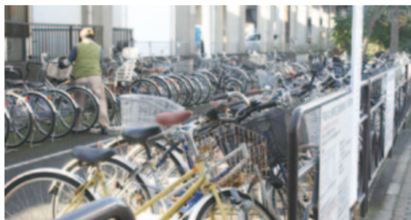
放置自転車対策として整備された駐輪場

市民参加と協働については昨年度、市民主体のまちづくりを全庁的に推進するための組織を総合政策局に設置した。一方、市民に身近な町内自治会の育成などは従来どおり市民局が担っているが、本年度から区役所を市民主体のまちづくりの拠点と位置づけ、地域づくり活動への支援などに取り組み始めたところである。効率的に施策を推進す