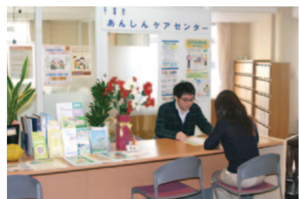
増設が予定されている「あんしんケアセンター」

答 現在12か所あるあんしんケアセンターの担当区域に配慮しつつ、地理的条件や高齢者人口の見込み、交通事情を勘案して市域を24圏