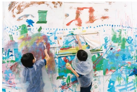
[参考] 「3331 夏のこども芸術学校」より