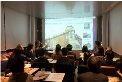
[参考] スクーリングの様子

多様なジャンルのアーティストや専門家から文化芸術が持つ魅力や可能性を学びます。また、地域の課題解決に文化芸術をどのように活かしていくことができるのかを共に考え、実践に繋がります。