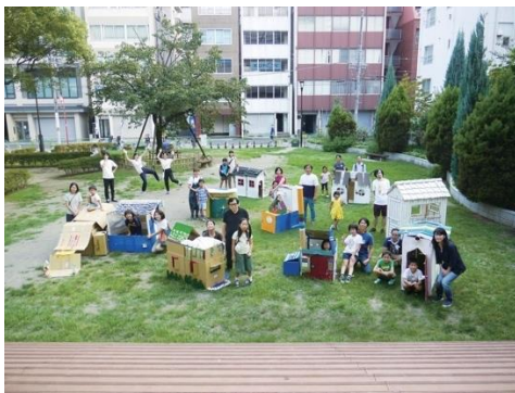
[参考] ワークショップ「わたしの家は、どんな家？」より ※アーティスト村上慧によるワークショップ

市内の学生に、芸術祭ならではの芸術教育の時間を設け、文化芸術が持つ多様な表現の力を理解し、将来千葉市の文化芸術活動に興味を持つ人材の育成に繋がります。