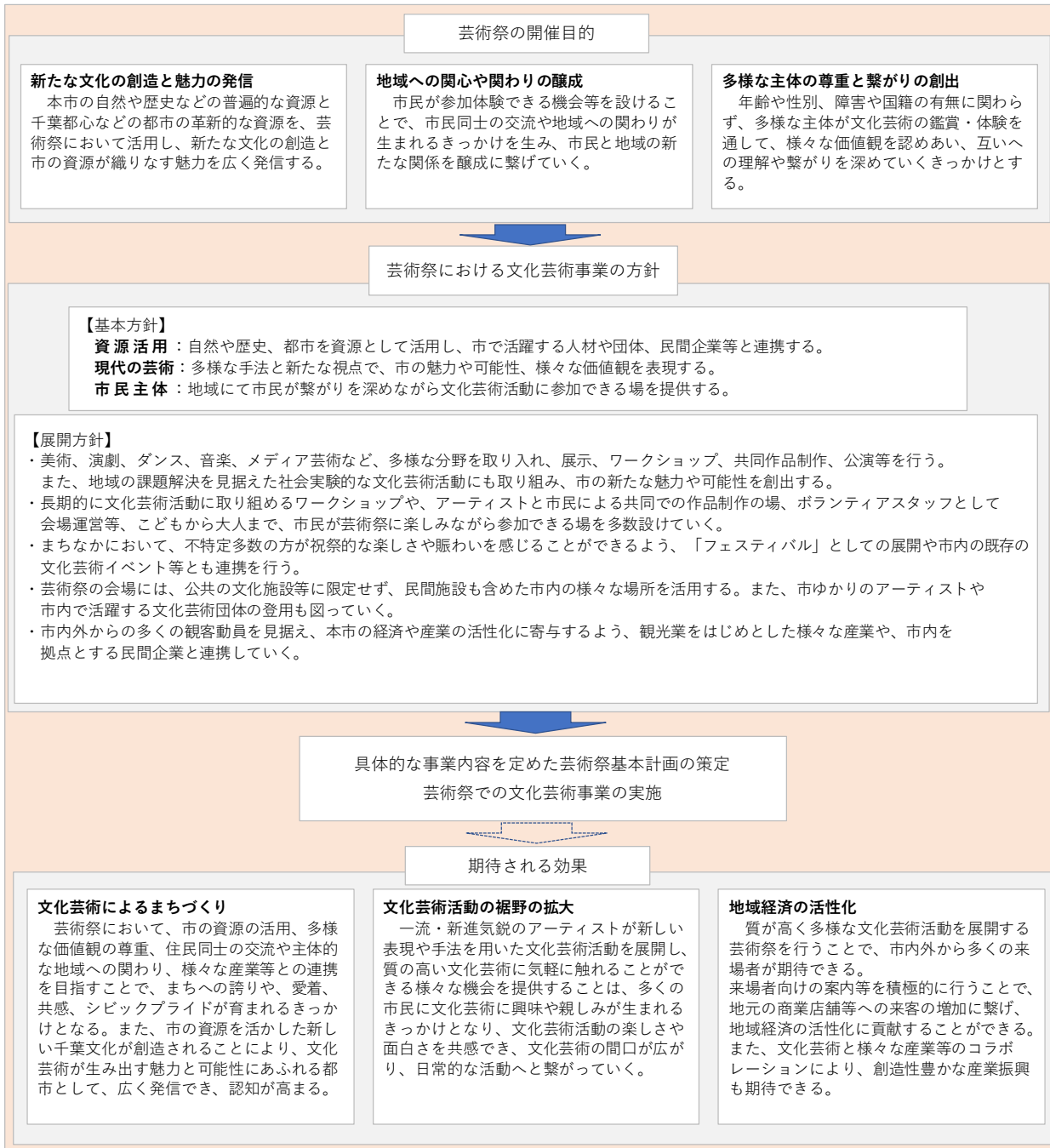
【図：芸術祭の定期開催に向けた基本的な考え方】