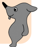
2010年ゆめ半島千葉国体ゆめ半島千葉大会マスコットキャラクター「チーバくん」