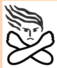
女性に対する暴力根絶のためのシンボルマーク

DVは、どこの家庭でも起こりうる身近な問題であり、そして、多くの場合、被害者は女性です。平成20年に内閣府が行った調査によると、女性の約3人に1人が被害を受けているという結果が出ています。DVは、家庭内で起こっているため外からは発見しにくく、周囲が気づかないうちにエスカレートし、被害が深刻化していく傾向があります。