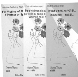
▲外国人向け 8か国語 (英・中・韓・タガログ・スペイン・ポルトガル・タイ)