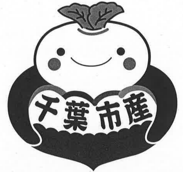
千葉市地産地消シンボルマーク

認証を受けた生産者は、別途使用申請することにより、千葉市地産地消シンボルマークを認証マークとして、農産物や出荷資材、PR用ポップ等に使用することができます。