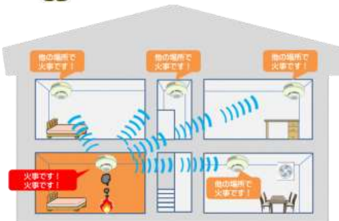
【無線式連動型住宅用火災警報器イメージ】