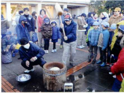
伝統文化にふれあえる絶好の機会です