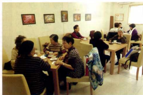
賑わうふれあいサロン

好評のふれあいサロン 昨年11月8日にオープンした幸町1丁目ふれあい交流館が好評です。中でも火曜日以外は毎日開いているふれあいサロンは、連日大勢の人で賑わっています。