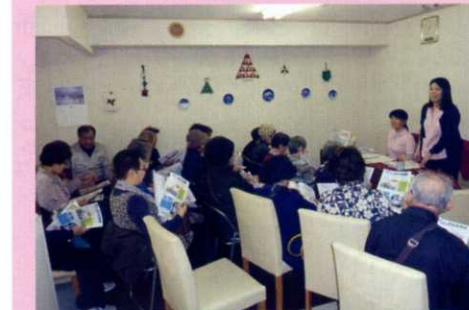
安心ケアセンターのミニ講演会

こうした現状を千葉市の教育委員会が視察に訪れ「とても大切な取り組み」と評価していました。