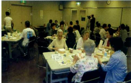
昼食を取りながらの楽しい懇談会

「安心サポーターの会って何?」「近所の方向士の助け合いの会です。」「誰が手助けしてくれるの?」「おなじ町内に住んでいるボランティアが手助けしてくれます。」「どうしたら利用できるの?」「下記に電話をかけて、事務局の人と話しをすれば利用できます。安心サポーターへの問い合わせも、こちらにおかけ下さい。」「費用はいくらかかるの?」「会に入る時に、利用者入金金千円をいただきます。あとは仕事を頼むたびに利用料をいただきます。一回一時間以内五百円です。ゴミ出しは一回につき百円です。」「どんな仕事を頼むことができますか?」「日常のゴミ出し、おそうじ、日曜大工、買物、病院付添いなど、いろいろです。」