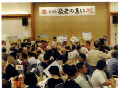
幸三小の子どもたちのおもてなし

幸二中生が会場設営・撤収に、そして、吹奏楽部も開会前の雰囲気作りに活躍しました。幸三小2年生全員で可愛いお祝いの歌を披露してくれました。6年生のお祝いの言葉も心がこもっていました。和やかな気持ちで会食、お喋りと時を過ごし、最後はみんなで懐かしい歌を3曲歌いました。地域の皆様の協力で和気あいあいの中に閉会を迎えることができました。