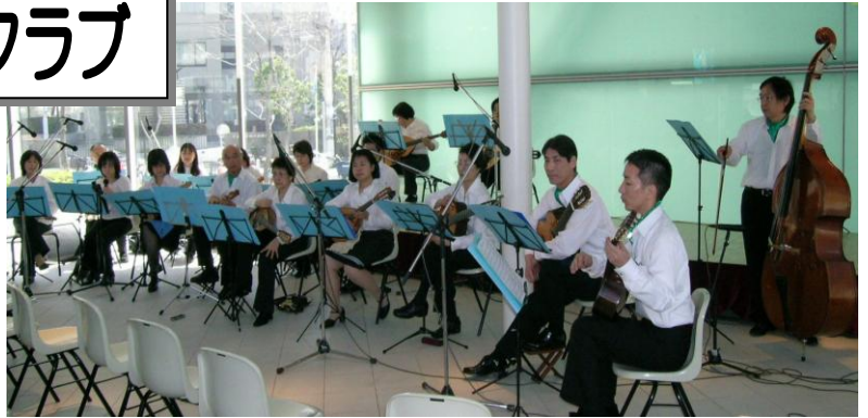
「千葉市民活動フェア in きぼーる」での演奏の様子

「高齢者の多いコンサートで、古賀政男メロディや唱歌を演奏したときは、とても盛り上がり、一緒に歌ってくださったり、涙を流して聴いてくださったり…、お