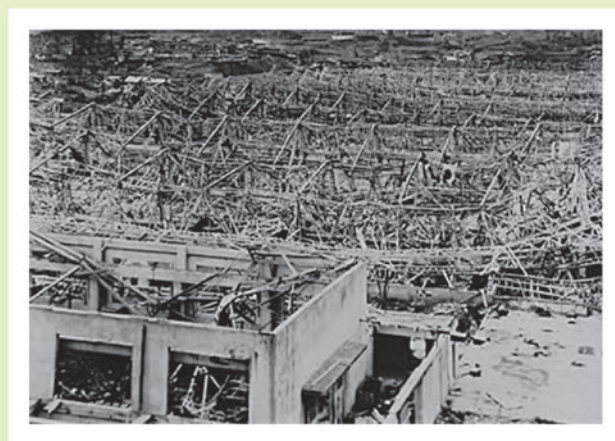
被爆した三菱兵器製作所大橋工場