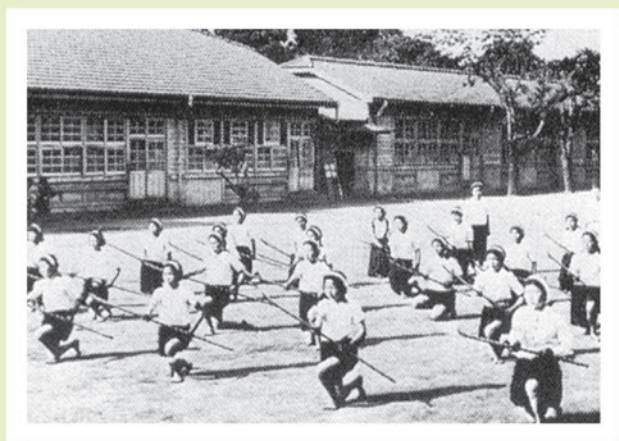
国民学校における「なぎなた」の練習風景