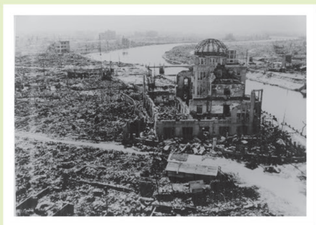
被爆後の原爆ドーム