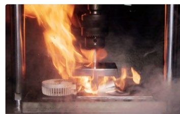
つぶされたバッテリーの発火事故の再現

リチウムイオンバッテリーは外部からの衝撃が加わり、へこむなどすると内部ショートが生じ、発煙や発火につながります。リチウムイオンバッテリーを搭載した製品は小型のものも多く、手をすべらせて落下させたり、ポケットに入れたまま座って体の下敷きにしたりなどして事故となることがあります。外部からの衝撃が加わることのないよう注意しましょう。