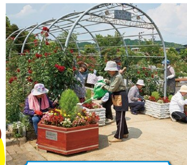
フラワープランター