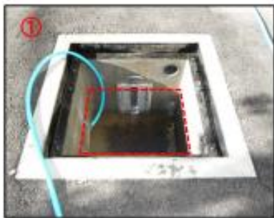
貯水槽に水を貯めます (赤線以上)