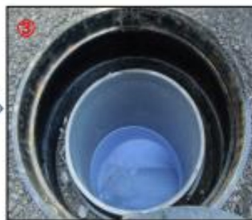
勢い良く水が流れ、汚物を 流下させます