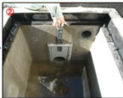
水を貯めてスライドゲートを 開けると