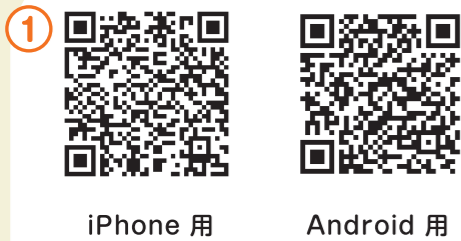
iPhone 用 Android 用