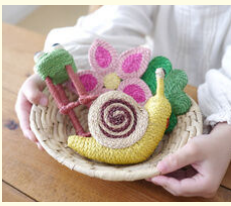
バングラデシュ PRIYO handicrafts