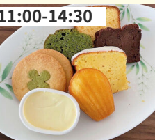
11:00-14:30 焼き菓子 IChi imu