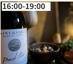
ヨルダン ZUMOT JAPAN