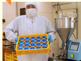
濃厚アイス オリーブの樹