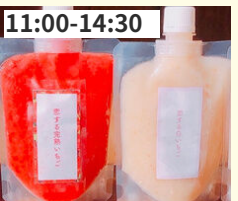
11:00-14:30 恋するスムージー 食育ネット