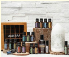
doTERRAのアロマオイル enjoy aroma life