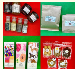
Pure Honey はあもにい