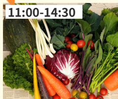
11:00-14:30 地元野菜、竹炭パウダー ファームサポート千葉