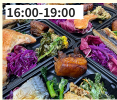
16:00-19:00 Tomo's cafe