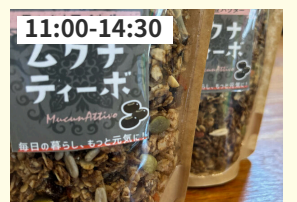
11:00-14:30 ミャンマー産ムクナ豆の グラノーラ 自然食じねん