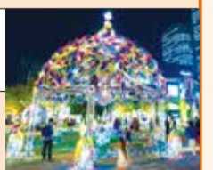
幕張新都心イルミネーション