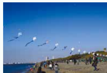
たくさんの凧が空に浮かびます

*市内在住・在勤・在学で凧を自作し、10:30～11:30に凧をあげている方を対象に審査の上、入賞者を決定し、表彰します。