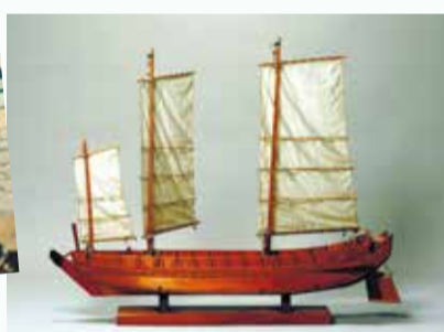
五大力船模型 木更津市郷土博物館金のすず蔵

☎郷土博物館 ☎222-8231 ☎225-7106 月曜日（祝日の場合は翌日）休館 千葉県立郷土博物館