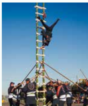
はしご乗りは圧巻！