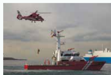
勇壮な演技をご覧ください