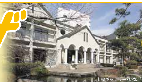
市民ギャラリーいなげ

人口:160,014人 前月比101人減 (男79,918人 女80,096人) 世帯数:75,655世帯 (2022年3月1日現在)