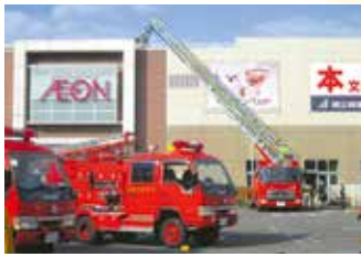
令和元年度の様子

秋の全国火災予防運動が11月9日~15日に実施されます。緑消防署では防災意識の高揚を目的とした消防演習を実施します。演習時には消防車のサイレンを鳴らしますが、火災ではありませんのでご注意ください。近隣の皆さんにはご迷惑をおかけしますが、ご理解とご協力をお願いします。演習の見学は自由ですので、ぜひお越しください。