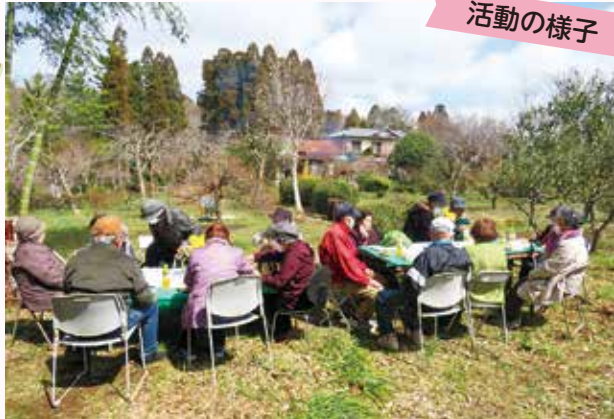
季節の草花を楽しみながら、地域の成り立ちや歴史について理解を深めました。