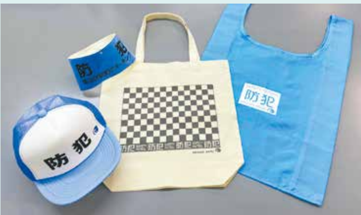
帽子または腕章、エコバッグ(布製またはナイロン製)

注意事項 ・活動の際には、帽子、腕章、エコバッグのいずれかを携帯してください。 ・犯罪を目撃した場合は、犯人を捕まえようとするなど危険な行為は行わず、直ちに警察に通報してください。 ・千葉市ボランティア活動補償制度の適用対象外です。