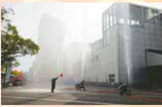
令和3年度の消防演習風景

美浜消防署では、11月7日(火)8:00～9:00までの間、美浜区真砂5丁目15-2 千葉市美浜保健福祉センター・文化ホールにおいて秋季消防演習を実施します。自衛消防隊および消防隊による消火活動、消防ヘリコプターやはしご車による救出訓練が実施されます。