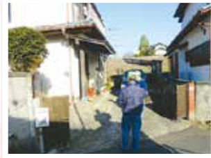
【高齢者見守り活動】