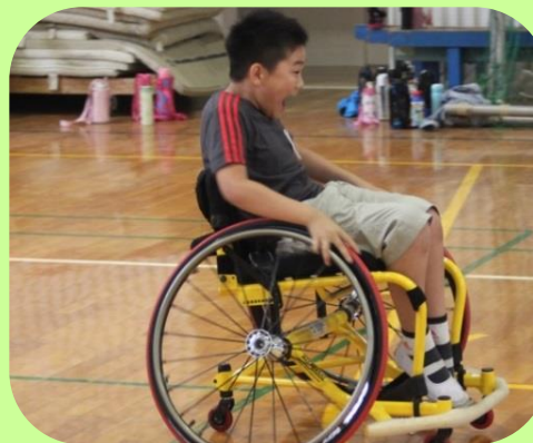
競技用車いすの 乗車体験