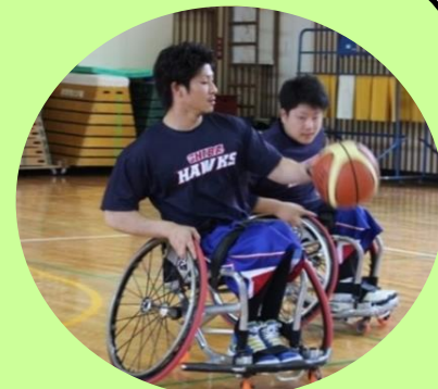
障害者アスリートの学校訪問