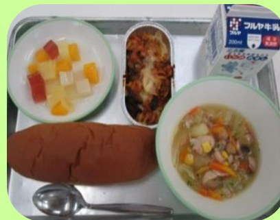
オリパラ応援メニュー