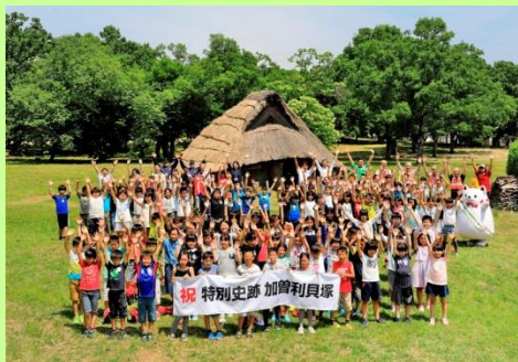
復原住居前に集まった地元の小学生