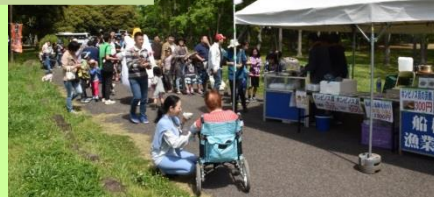
縄文春祭りでの貝料理提供