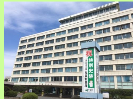
市役所前の懸垂幕