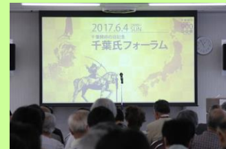
千葉氏フォーラム（6/4） （260人来場）