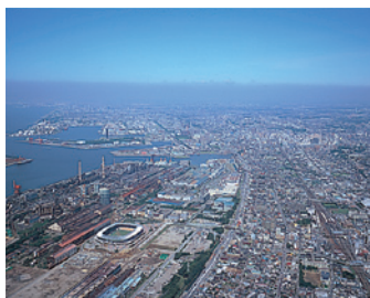
蘇我副都心から千葉都心を望む