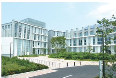
千葉市青葉看護専門学校（看護師養成施設）