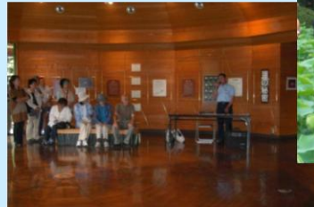
平成20年7月 大賀ハス観察会