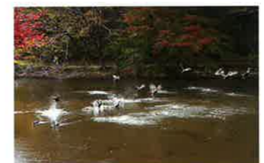
3 下の池 コイやガチョウ、カモなど、様々な水辺の生き物に会える、園内で最も大きな池です。