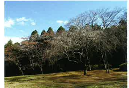
5 お花見広場 シンデレザクラが目をお花見スポットです。園内には約1,500本ものサクラの木があります。