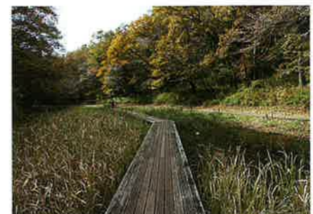
7 湿生植物園 ウッドデッキがあり、初夏に咲くコウホネやハンゲシヨウを、間近で見ることができます。