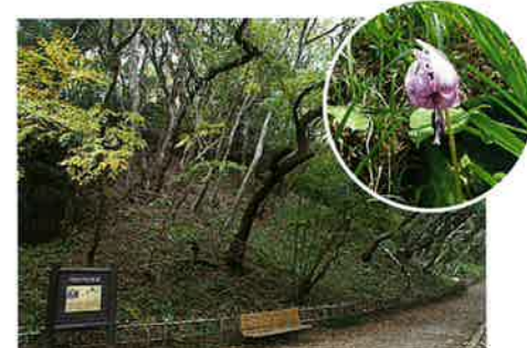
6 カタクリ自生地 県内最大級のカタクリ群生地。見頃は3月下旬~4月上旬。斜面いっぱいに紅紫色の花が咲きます。