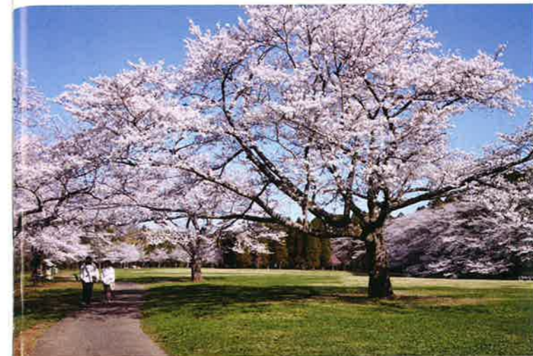
2 草原 子ども達が思い切り走り回れる広い芝生の広場。サクラの季節は絶好のお花見スポットになります!

〒千葉市若葉区野呂町108 若葉公園緑地事務所 ☎043-228-0080 開 4~9月/8:30~17:00、10~3月/8:30~16:30 休 無休 〇 JR千葉駅前バスターミナル10番から、ちばフラワーバス「成東駅」行き、または「中野操車場」行きで約45分 〔泉公園入口〕下車、徒歩約10分 〇 千葉東金道路「高田IC」下車、東金街道方面へ約1分 P 有り (有料) 普通車400円、マイクロバス1,000円、大型車1,500円 駐車場利用時間 4月~9月/8:30~16:30 10月~3月/8:30~16:00 年末年始/10:00~15:00 ※駐車場の入場は開園の30分前まで 千葉市 泉自然公園 検索