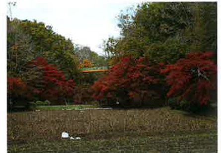
4 高瀬田 例年、6月中旬頃が見頃となります。シヨウブ越しの「いずみ橋」は、絶好の撮影ポイントです。