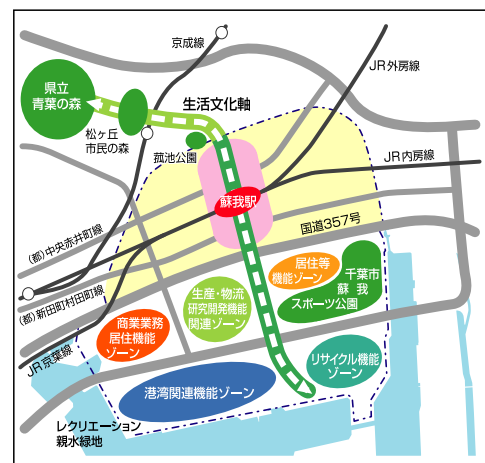
図-4 「生活文化軸」の構成図