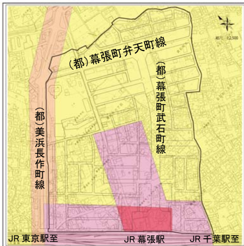
図-1 現在の用途地域