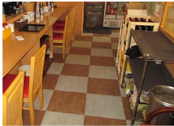
02 1階店舗カウンター