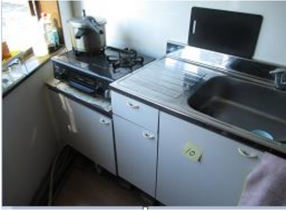
09 3階 キッチン