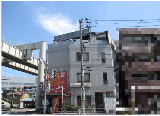
01 北側から見たセイフティビルの外観