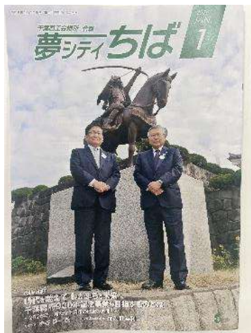
「夢シティちば」 (令和8年1月号)