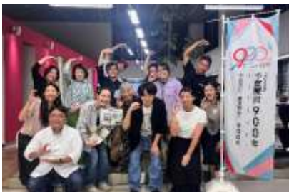
セミナー・交流会