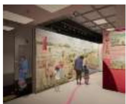
いにしえチバウォール