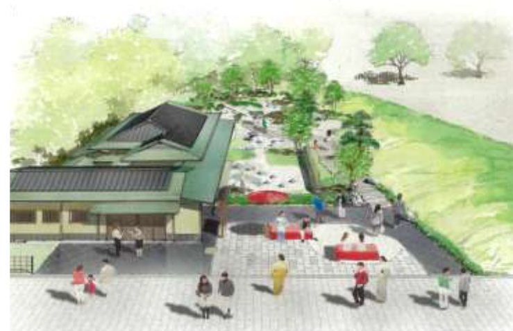
リニューアル後イメージ

見通しのきく門・柵、歩きやすい園路、四季の変化が楽しめる 花木の植栽など、来園者が親しみやすい設えへと再整備。