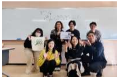
起案に向けた伴走支援