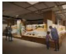
中世まちなみグラフィック