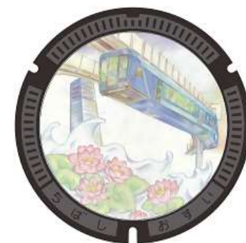
千葉市都市モラル部門