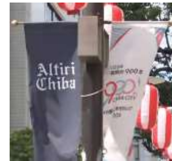
中心市街地(千葉商工会議所)