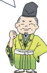
千葉介 (ちばのすけ)