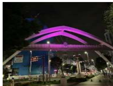
セントラルアーチ照明(建設局)