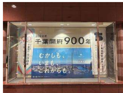
センシティショーケース