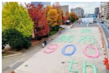
千葉開府900年カラー土囊 (建設局)