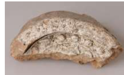
れんげもんのきまるがわら 蓮華文軒丸瓦