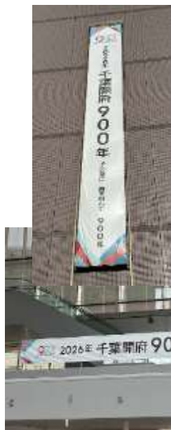
区役所懸垂幕・横断幕