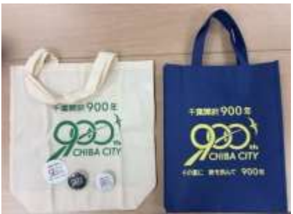
ノベルティグッズ