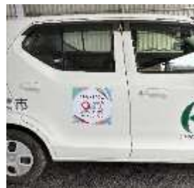
公用車マグネットシート