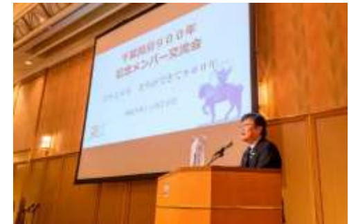
記念メンバー交流会