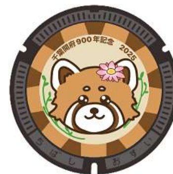
千葉市動物公園部門