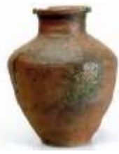
常滑長頸壺 (市指定文化財)