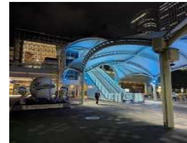
海浜幕張駅南口駅前広場 シェルター照明(同左)