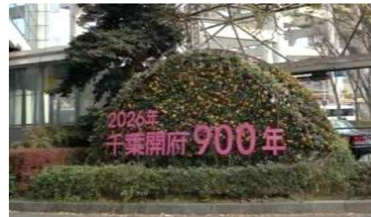
千葉駅前トピアリー(都市局)