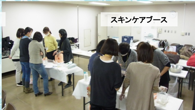
スキンケアブース

その後、 1)スキンケアブース 2)車椅子ブース 3)除圧マットレスブース 3グループに分かれて演習を行いました。