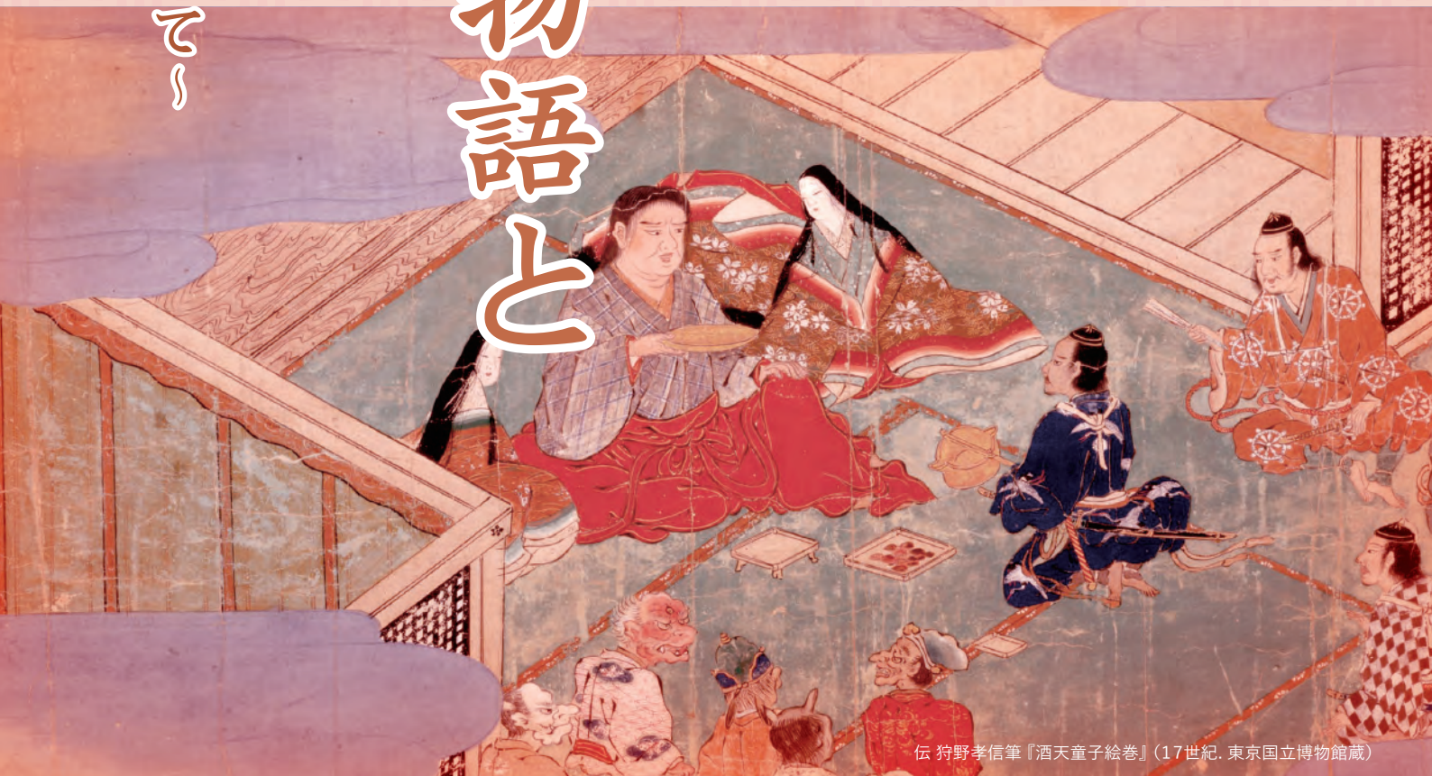
伝 狩野孝信筆『酒天童子絵巻』(17世紀. 東京国立博物館蔵)