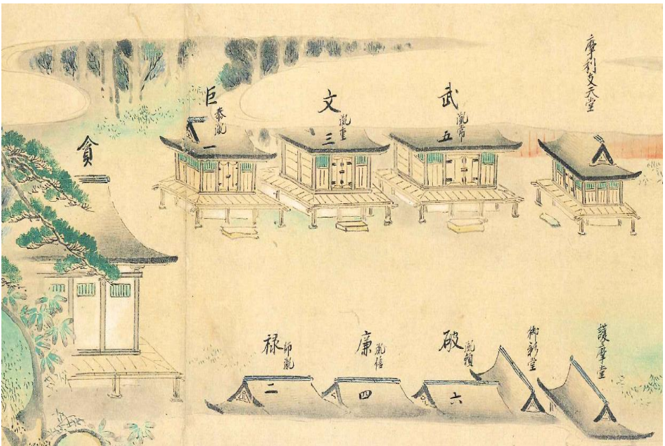
金剛寿院伽藍（「千葉妙見大縁起絵巻」）