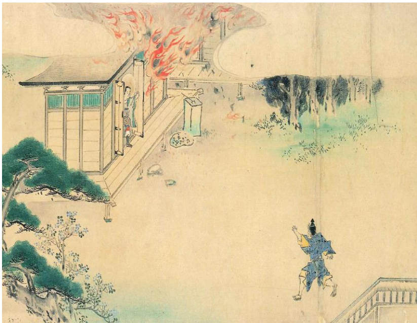
客殿焼失（「千葉妙見大縁起絵巻」）