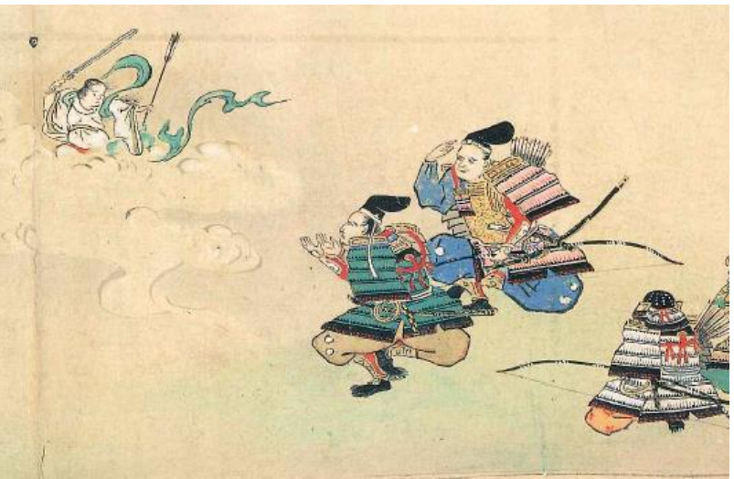
妙見神と平良文・平将門（「千葉妙見大縁起絵巻」）