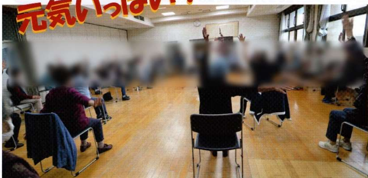
松ヶ丘公民館で (10月26日)