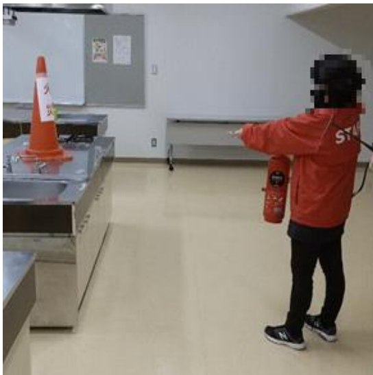
調理実習室での消火器訓練

消防設備の点検会社である、能美防災様にもご協力いただき、火災報知器が作動してから通報・避難誘導・消火までの一連の流れを確認しました。