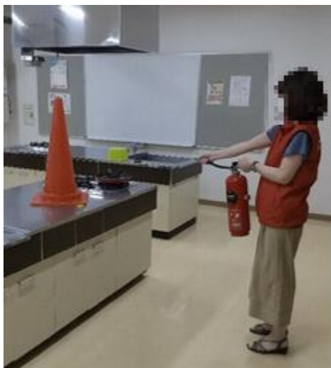
調理実習室での消火器訓練

消防設備の点検会社である、能美防災様にもご協力いただき、火災報知器が作動してから通報・避難誘導・消火までの一連の流れを確認しました。