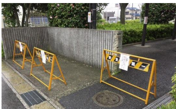
南側駐輪場に開館前と閉館後にバリケードを設置