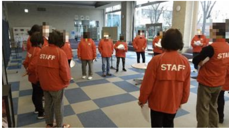
消防訓練を終了してのミーティング