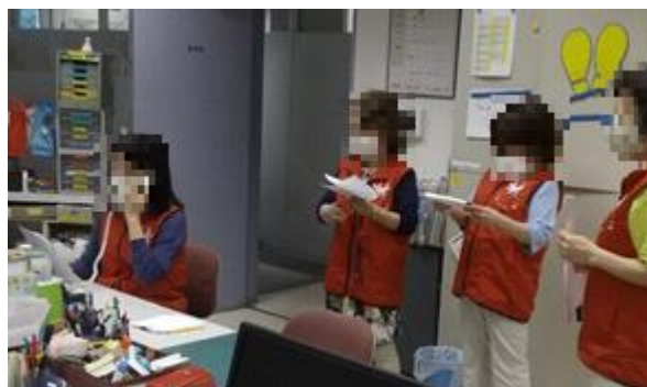
119番通報を実際に行い、的確に答える訓練