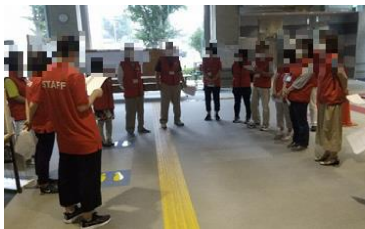
消防訓練を終了してのミーティング