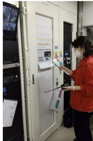
中央監視室にて防災システム操作訓練