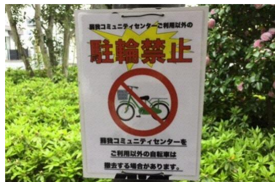
南側駐輪場に当センター利用者以外の駐輪禁止の案内を設置