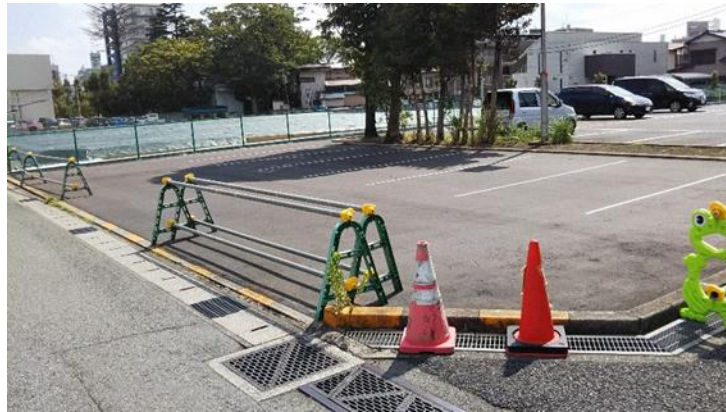
令和元年8月8日より縮小されていた箇所並びに拡張された箇所の写真