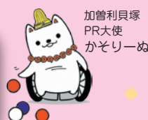
加曽利貝塚PR大使 かそりーぬ