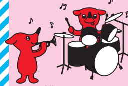
千葉県PRマスコットキャラクター チーバくん