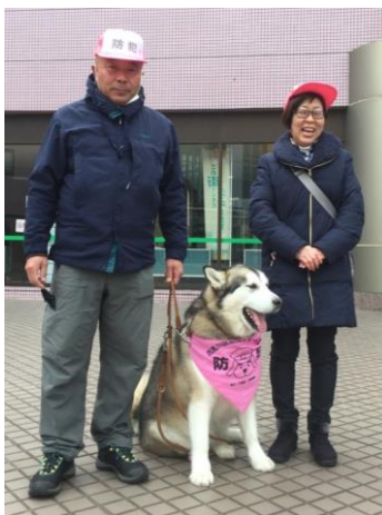
アラスカンマラミュート サワちゃん