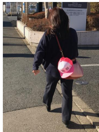
帽子を鞆に着けた事例 (頭にかぶらなくても、 防犯をアピールできます)