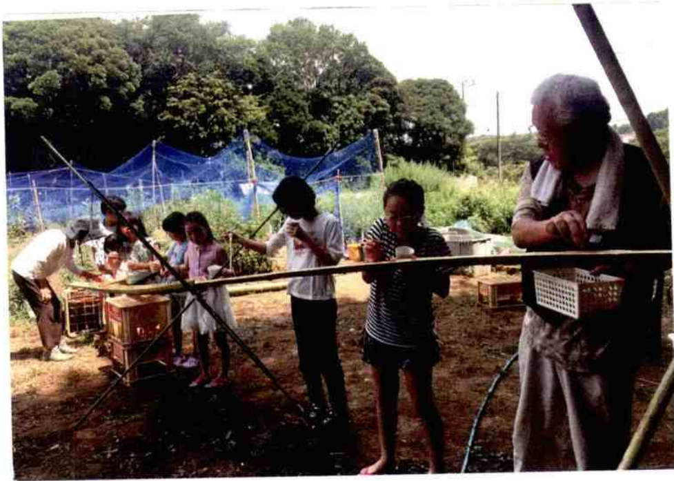
8月の流しゆめん サンクス・ブルベリ園の前で