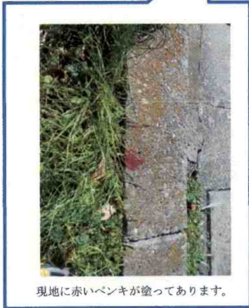
現地に赤いペンキが塗ってあります。