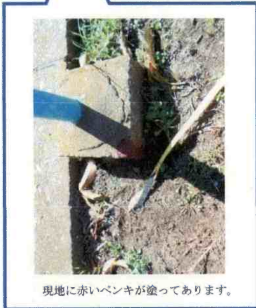
現地に赤いペンキが塗ってあります。