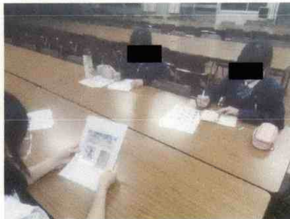
ミーティング風景

今回のプロジェクトには、 子供の健全育成 、 高齢者の健康寿命 を伸ばす取り組み、 コミュニティ作り 、そこに地域が抱える ゴミ問題 が含まれています。しかしそれ以上に『人間としての本当の豊かさ』を生徒たちが考えるいい機会になったと思います。