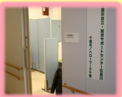
【自立・就労サポートセンター花見川】