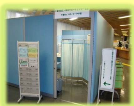
【自立・就労サポートセンター若葉】