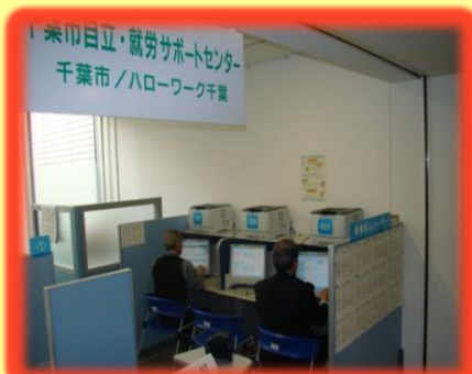
【自立・就労サポートセンター中央】