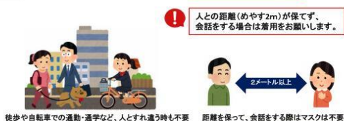
歩歩や自転車での通勤・通学など、人とすれ違う時も不要 距離を保って、会話をする際はマスクは不要

屋内 距離が確保でき 会話を ほとんど行わない場合をのぞき、 マスクの着用をお願いします。