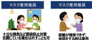
十分な換気など感染防止対策を講じている場合は必ずしも可 距離が確保できず、会話をする時は着用

屋内 距離が確保でき 会話を ほとんど行わない場合をのぞき、 マスクの着用をお願いします。